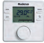
RC200RF Kablosuz Modülasyonlu Oda Kumandası