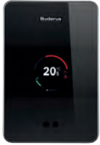
TC100 Akıllı Modülasyonlu Oda Kumandası

Logamax GB172i kendini kanıtlamış kontrol sistemi Logamatic EMS plus ile donatılmıştır. Bu sayede, aksesuar olarak sunulan Logamatic RC310 kontrol ünitesini kullanarak enerji tasarruf potansiyelinden tam anlamıyla faydalanabilirsiniz.