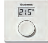
RC100 Modülasyonlu Oda Kumandası