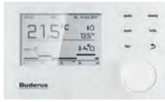
RC310 Modülasyonlu Oda Kumandası