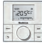
RC150 Modülasyonlu Oda Kumandası